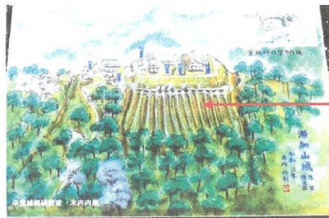
瀬加山城想像復元図(作・木内内則)

② 「山城」であった痕跡 堀切や土塁、東側面の 畝状堅堀群 等々。 8条ほどの畝状堅堀群は近辺の山城でも珍しい。 築城は室町時代中期嘉吉年間(1440年頃)に太田筑後守、 続いて同筑後守入道、同道祖法師、同源太郎と4代。