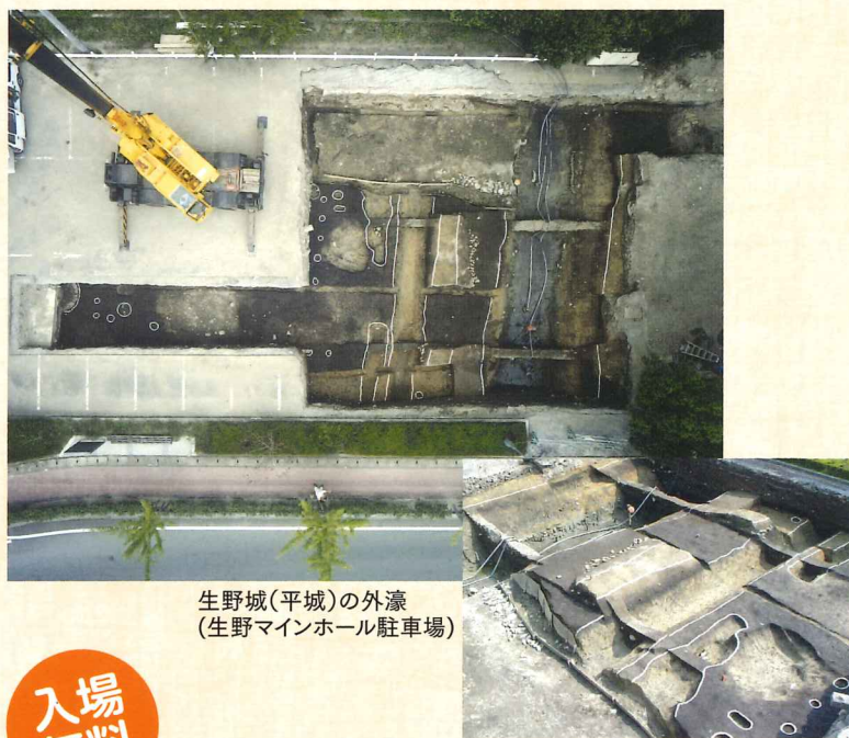
生野城(平城)の外濠 (生野メインホール駐車場)