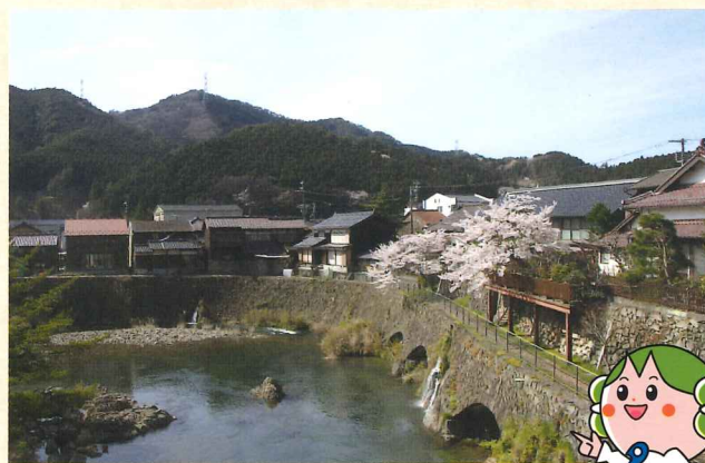
生野城の石垣の石を転用したトロッコ軌道跡