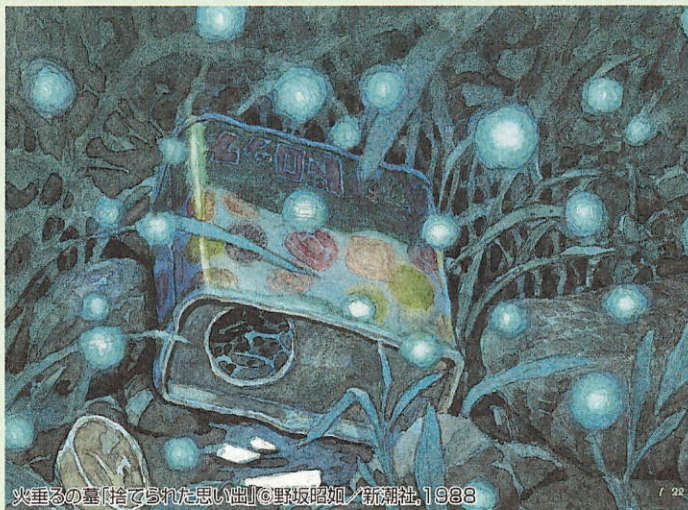
火垂るの墓「捨てられた思い出」©野坂昭如/新潮社、1988