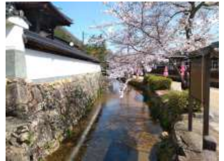
竹田駅のすぐ裏通りにお寺が4件並んでいます。そのうちの1つに、竹田城の最期の城主の菩提寺があります。歴史深い寺町通りをガイドしていただきます。 ↑写真:寺町通りの水路には、鯉が沢山泳いでいるそう!

★竹田駅周辺ガイド(寺町ガイド)終了後、解散します。 解散後は、自由行動です。竹田の街並みを満喫してください!